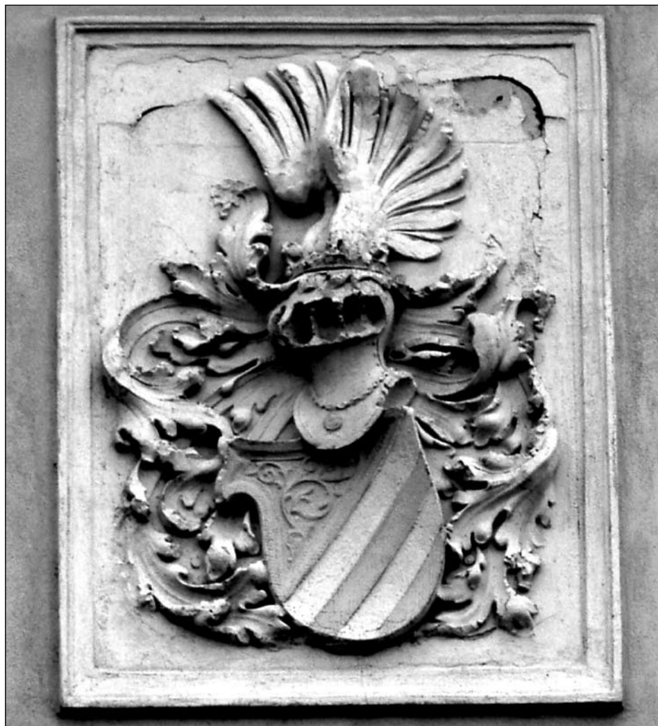
Znak rytířů Nebeských z Vojkovic na vile na Palackého třídě čp. 574 v Nymburce (dnes Základní umělecká škola). Oproti podobě znaku z majestátu z r. 1897 je hlavní odlišností použití turnajského helmu s korunou a dělení štítu, které jde pošikem (nikoli pokosem)!